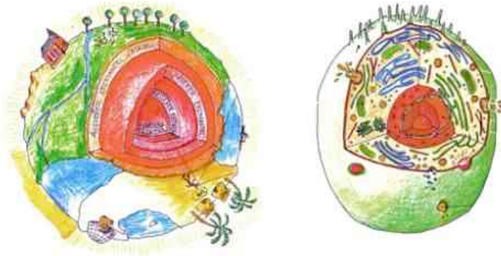
Die Erde und die menschliche Zelle